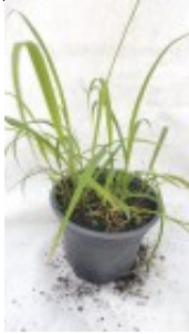
Zitronengras Bewertung: Noch nicht bewertet Produkt